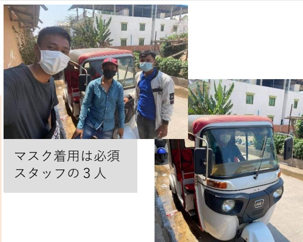
マスク着用は必須 スタッフの3人

麺を卸している飲食店は営業禁止になり、誰か陽性者が発生すると、居住する建物が丸ごと2週間閉鎖隔離され、外出のみならず外部との接触が一切禁止される。また、マスク着用や店舗の営業時間の違反があると、バイクまたは車の没収とペナルティーの支払いや刑務所に収監される場合もあり、厳しい措置に緊迫感がただよっている。